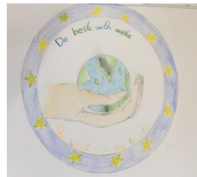
Aurora Tinghino (1F)