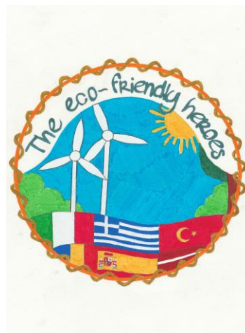
Beatrice Forzese (2E)